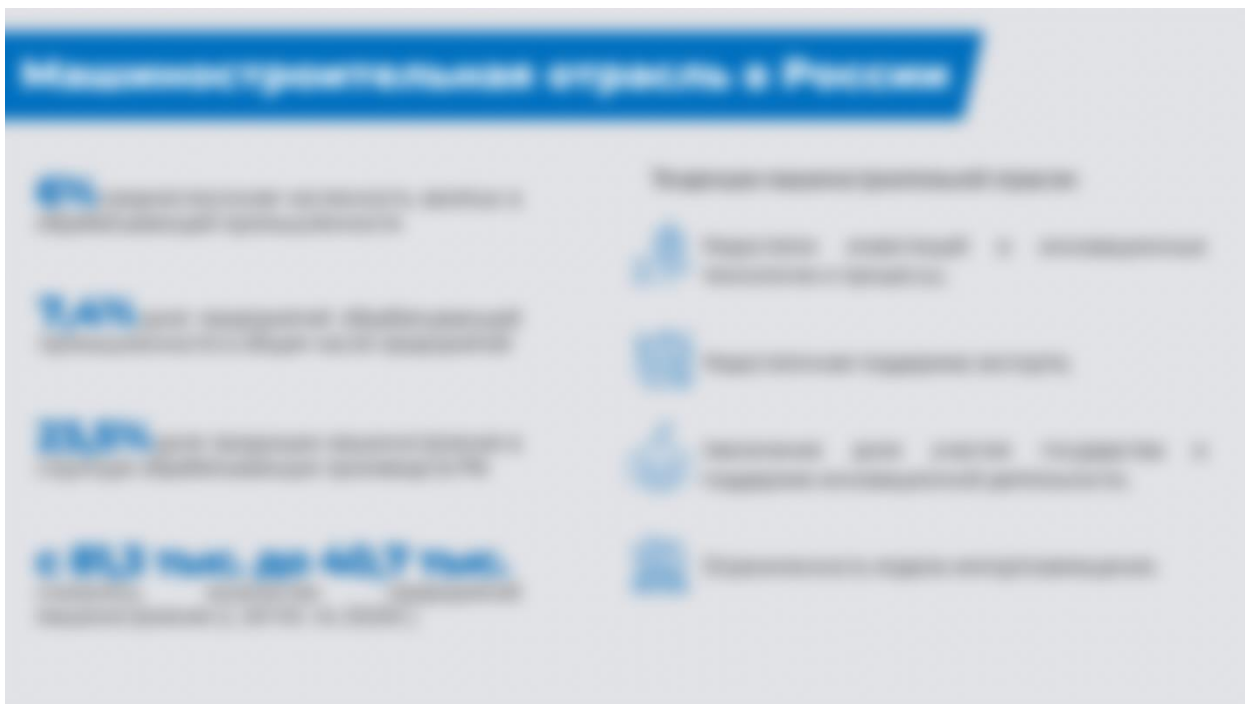
Рисунок 2. Тенденции развития машиностроения в Российской Федерации.