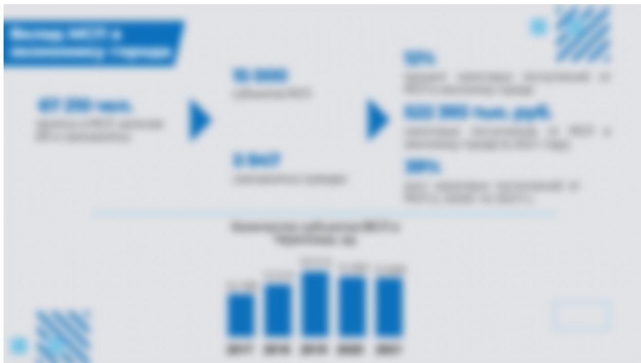
Рисунок 4. Вклад МСП в экономику города.

Ниже представлена общая краткая информация про вклад малого и среднего предпринимательства в экономику города по итогам 2021 года (рисунок 4).