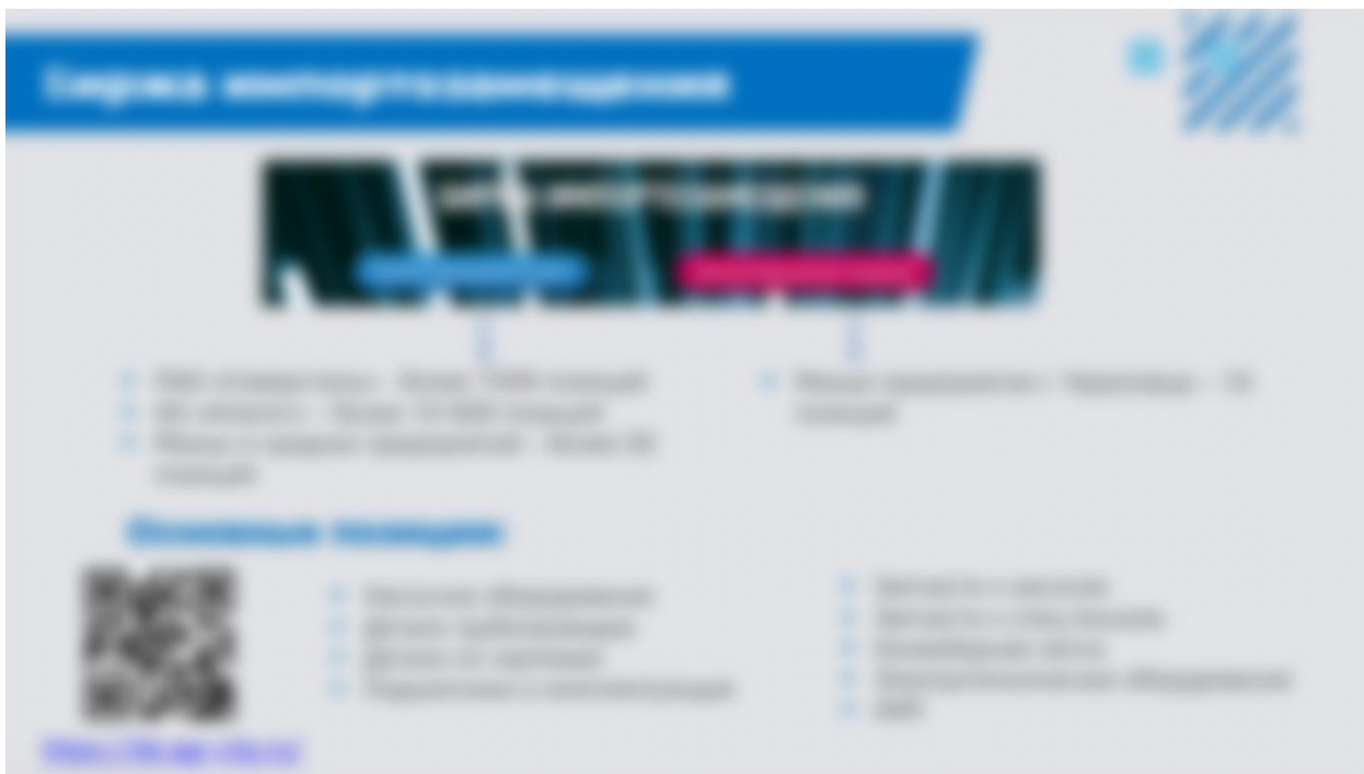
Рисунок 6. Биржа импортозамещения Вологодской области

На сайте Агентства Городского Развития https://agr-city.ru/ создан раздел Электронная бизнес-кооперация. На данной электронной платформе создан ресурс «Биржа импортозамещения», где размещаются заказы от крупных мировых компаний ПАО «Северсталь» - градообразующее предприятие Череповца и АО «Апатит» - второе по величине предприятие Череповца (рисунок 6).