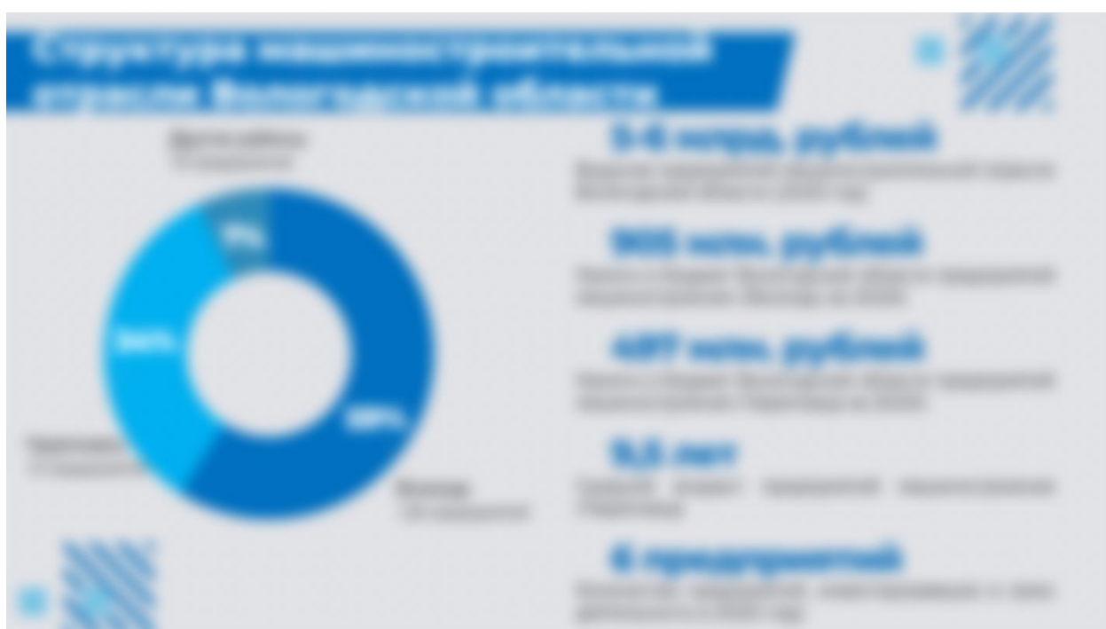
Рисунок 3. Структура машиностроительной отрасли Вологодской области.

Количество предприятий машиностроительной отрасли Вологодской области на протяжении последних пяти лет снижается, что характерно для отрасли машиностроения в целом по стране: